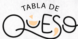
TABLA CHEESE WOMA ..... $70.000

Base de pomodoro, tomates cherry salteados, pesto, tomates confitados, rúgula, pimienta Burrata, acompañado con tostadas a las finas hierbas.